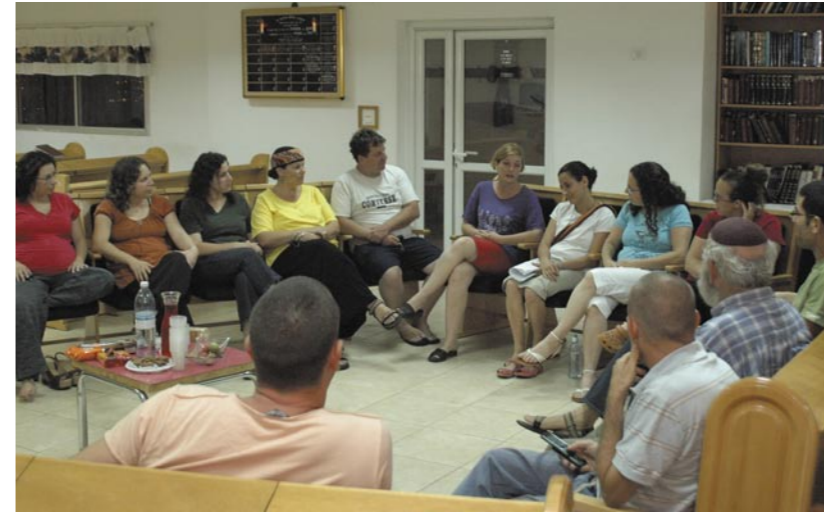
צוות ההקמה של הכיתה המגוונת בפגישה עם עמותת "מיתרים"