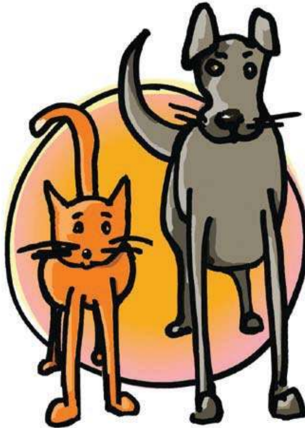
מסתנן מסודאן ונצר למשפחת קוזאקים

חזרנו חפווי ראש הביתה, המ"שיך במבה, כאשר בדרך קרוב לבית נתקלנו בשלט על אתר בנייה ובו כתוב: "פה ייבנה בית כנסת ליהדות מתקדמת". הסתכלנו זה בעיניו של זה ומיד החלטנו. מיהרנו לבית הרב ליהדות מתקדמת שם