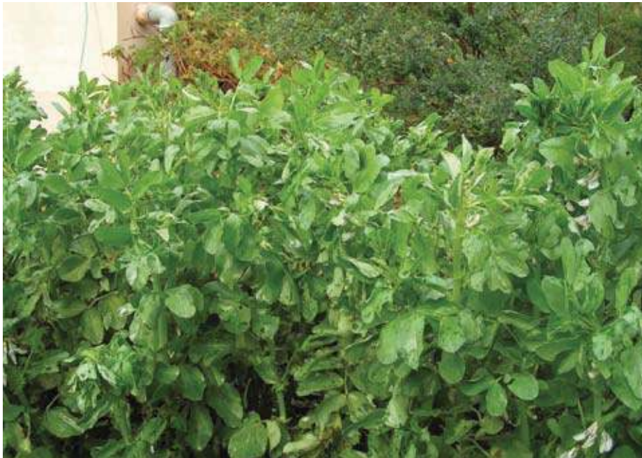
שיח הפול בגינת הכותב. היחיד שאף פעם לא מאכזב

מהן הצרות בפוקישומה לעומת ההתמודדות שיש לי עם חצילים